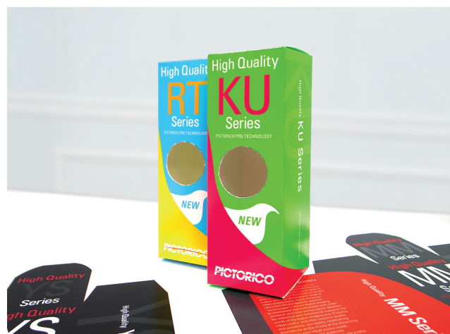
制作見本例：ゴルフボールケース Printed on ピクトリコプルーフ 厚手コート紙